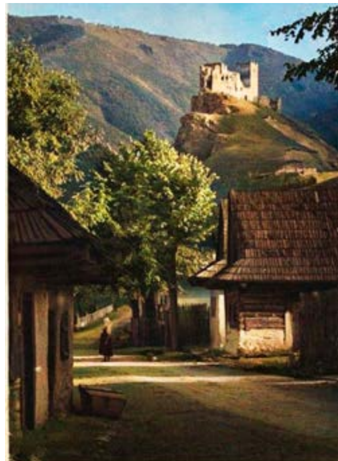
Slovensko: Hrad Strečno