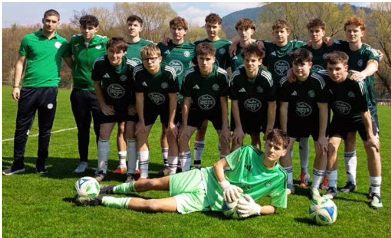
Na snímke: DORAST FK Strečno, v nových dresoch od sponzora: BISTRO Špicák a BOWLING Strečno