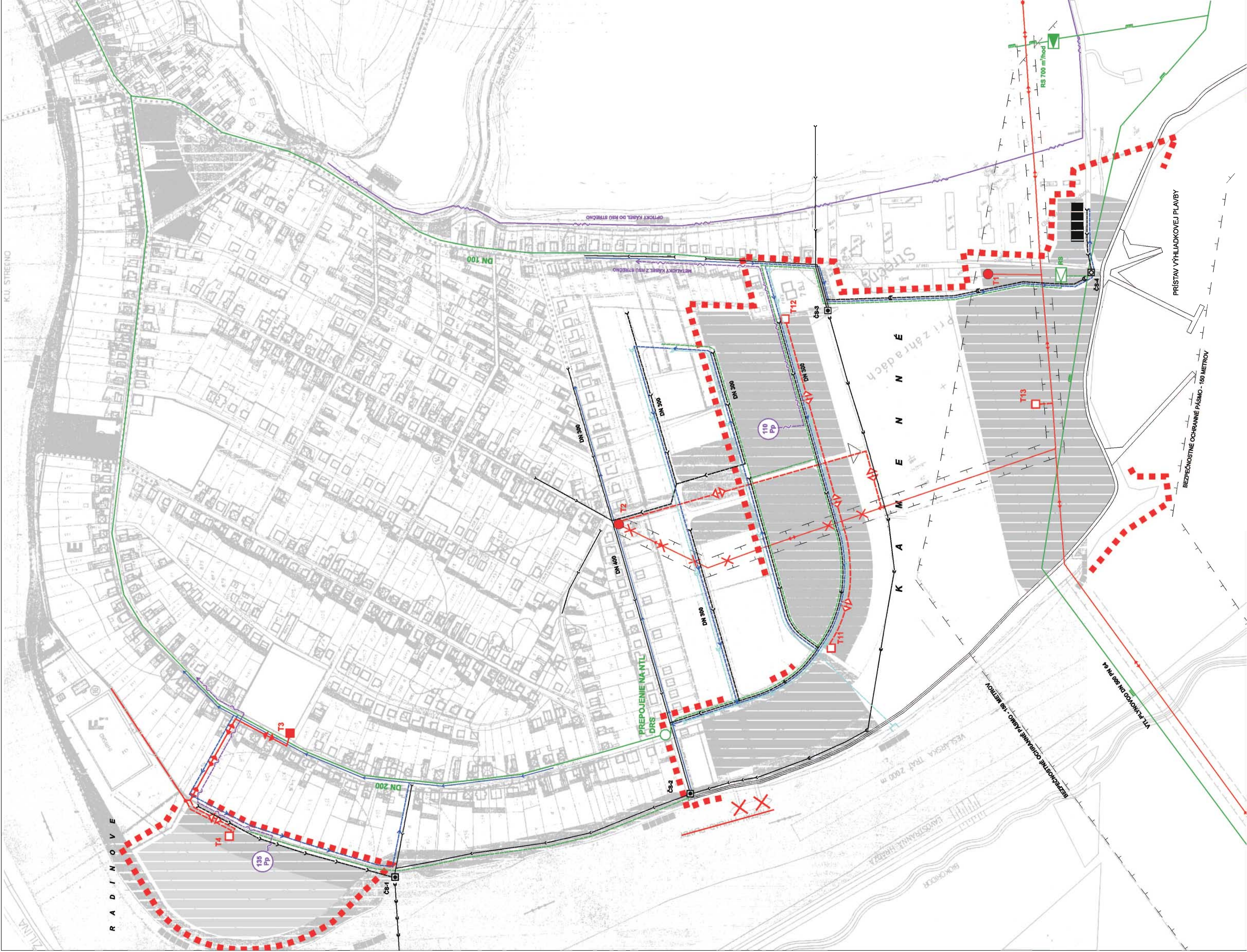
LEGENDA K DOPLNKU