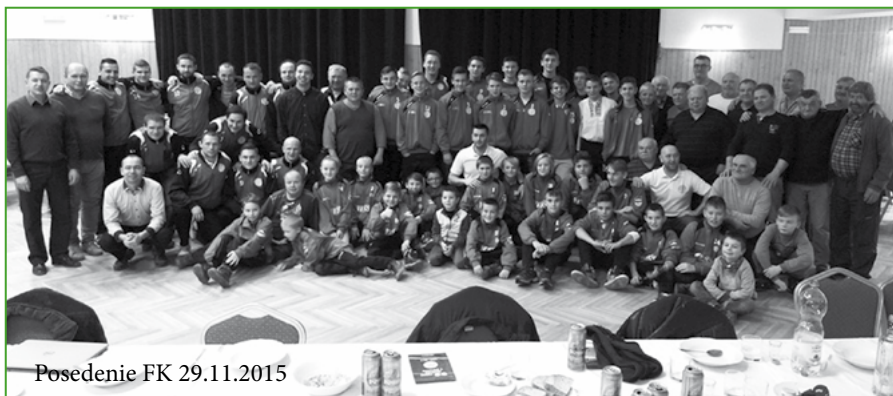
Posedenie FK 29.11.2015